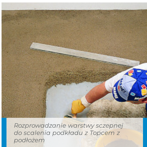
Rozprowadzanie warstwy szczepnej do scalenia podkładu z Topcem z podłożem