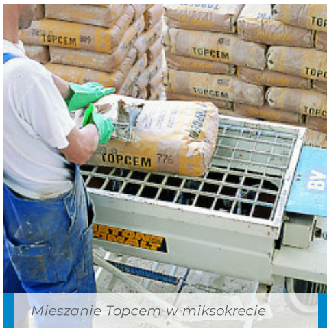
Mieszanie Topcem w miksokrecie