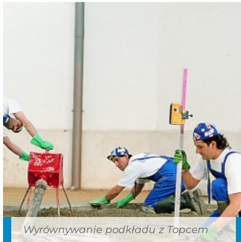
Wyrównywanie podkładu z Topcem