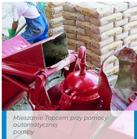
Mieszanie Topcem przy pomocy automatycznej pompy