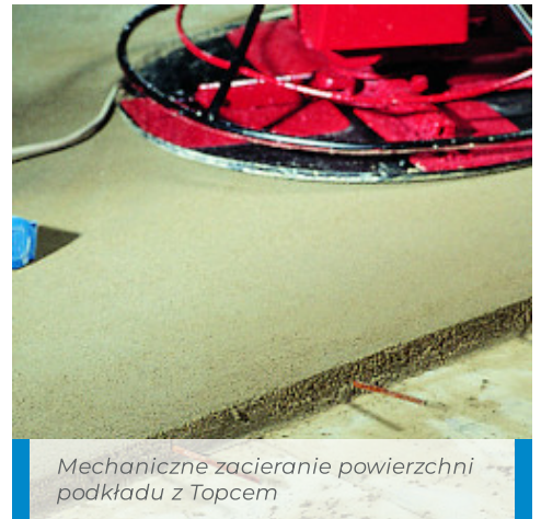
Mechaniczne zacieranie powierzchni podkładu z Topcem