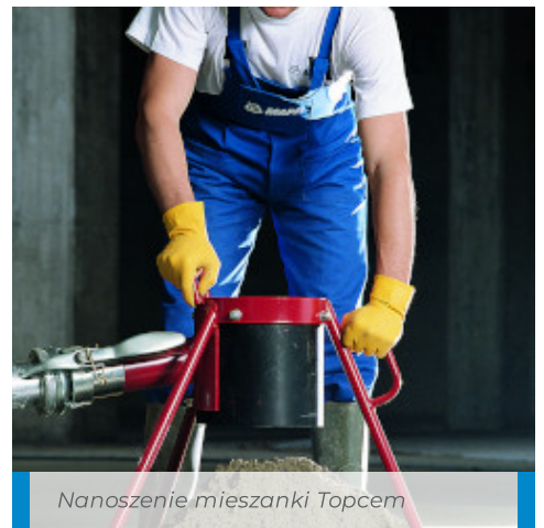
Nanoszenie mieszanki Topcem