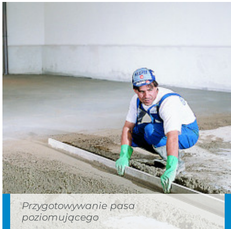
Przygotowywanie pasa poziomującego